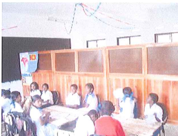
Mit den Stellwänden lassen sich die Klassenzimmer bei Bedarf teilen.

Mit diesem Ansatz begegnet Plan der Kinderarmut und den Kinderrechtsverletzungen. Neben allen am Projekt beteiligten Erwachsenen spielen auch die Kinder eine aktive und wichtige Rolle bei der Überwindung von Armut. Plan ermutigt die Mädchen und Jungen, ihre Potenziale zu entfalten und sich an der Gemeindeentwicklung zu beteiligen. Gerne schicken wir Ihnen hierzu ein ausführliches Informationspapier.