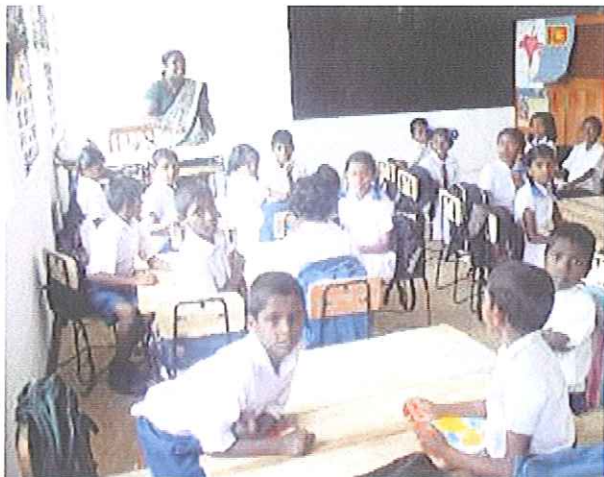
Die Kinder der Hunugala Schule haben ihre Schulmöbel erhalten. So macht Lernen Spaß!