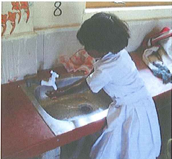
Die Rahatungoda Schule hat nun eine saubere Wasserzufuhr.

Die Direktoren und jeweils zwei Lehrkräfte der drei Schulen lernten in einem Workshop mehr über moderne, kindgerechte Lehrmethoden und übten deren Anwendung. Das neu erworbene Wissen geben sie an ihre Kolleginnen und Kollegen weiter.